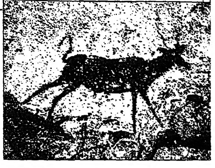
نقطة المراقبة في رسم الحيوان براعة في الإنشاع الشكلي من نغون ما قبل التاريخ